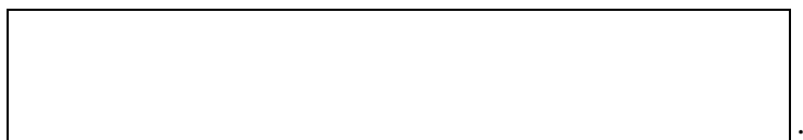
Схема границы эксплуатационной ответственности

Организация водопроводно-канализационного хозяйства